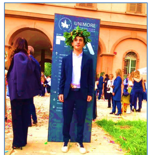
dottore del buco del c. vaffa...