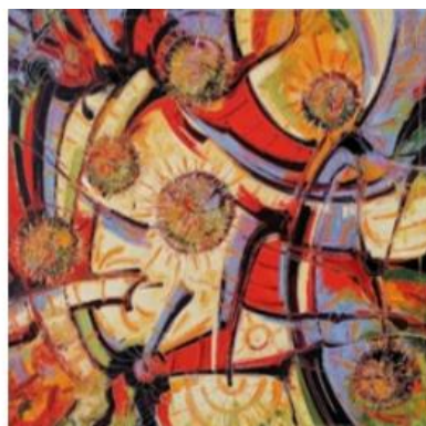
N° 32 - 32A