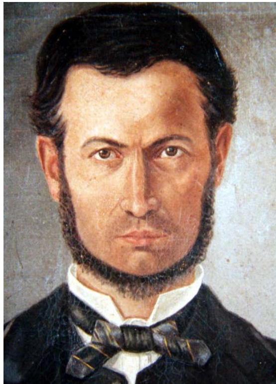
Olio su Tela.

Integrazione di quanto già scritto in proposito in Uomini illustri di Mormanno , edizione cartacea Phasar, Firenze 2000 e della successiva sul web.