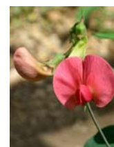
Fiore di cicerchia

27. Di un calcolo in sede inusitata. Estratto dagli atti della Regia Accademia medico-chirurgica di Napoli, 1895-1986.