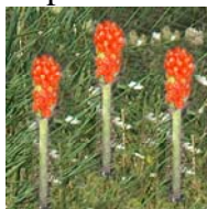
Gichero o arum italicum o calla selvatica

25. Resoconto degli atti della Società Filomatica di Mormanno anno 1871- 1972- 1874.