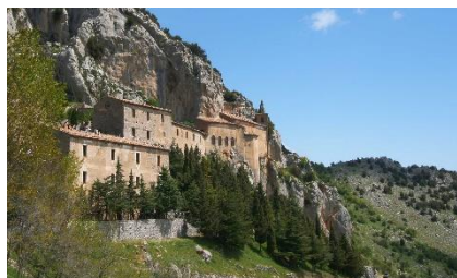
Santuario della Madonna delle Armi.

Oltre alle scuole dei centri, tra cui quelle di Francavilla M. e Cerchiara ove esistono edifici scolastici, ve ne sono altre sparse nelle frazioni.