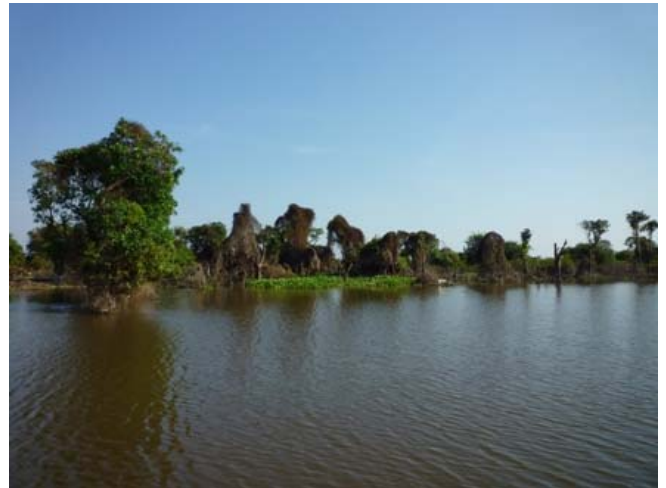
Villaggio galleggiante sul lago Tonle Sap

Tonle Sap significa 'Grande Lago' ed è un sistema combinato di lago e fiume di enorme importanza per la Cambogia. È il lago più grande del Sud-est asiatico che è stato designato come una biosfera UNESCO nel 1997.